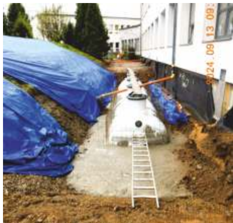
Příprava podloží pod nádržemi