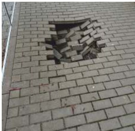
Propadnutý chodník havárie dešťové kanalizace. Při netěsnosti ležaté dešťové kanalizace vymlela voda ze střechy kavernu pod chodníkem a parkovacím místem