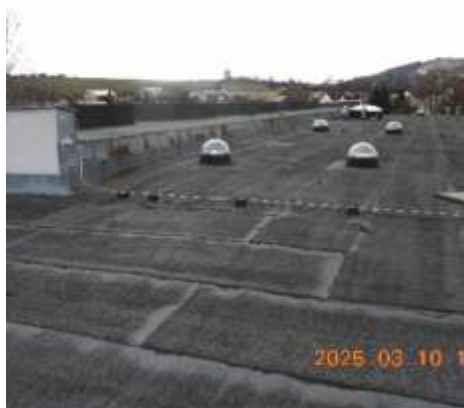
Původní krytina na MŠ A tělocvičně