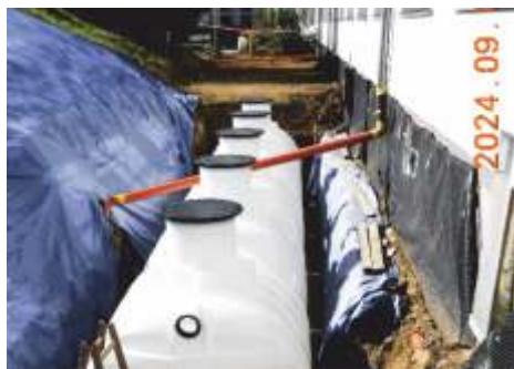
Napojení svodů na wc ZŠ