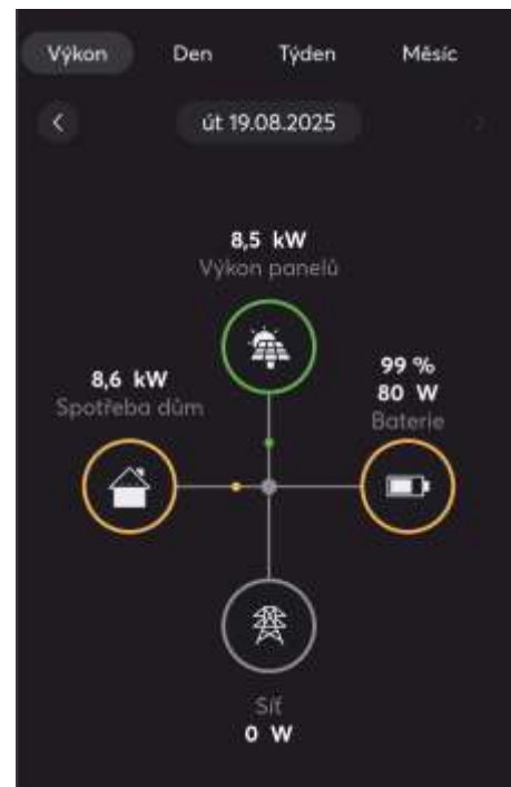
Monitoring toku energie na střeše ZŠ