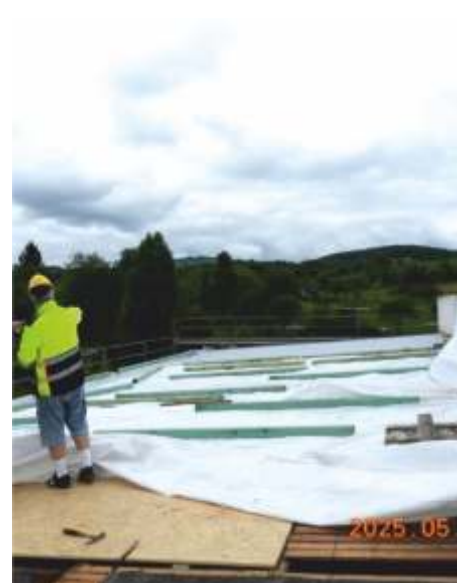
V průběhu realizace opravy střešní krytiny