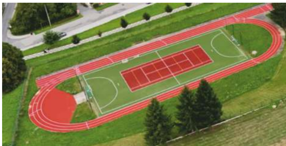
Rekonstrukce oplocení a povrchu školního sportoviště