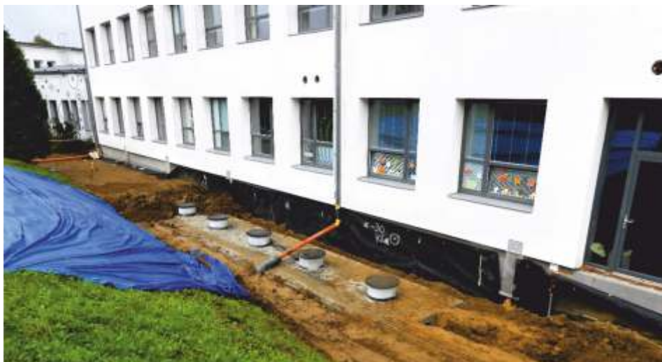
Nádrže již zasypané a zabetonované