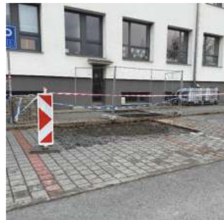
Zajištění místa havárie