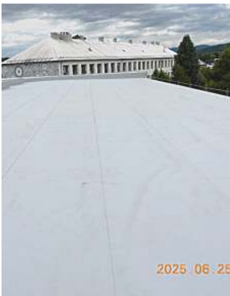
Nová skladba s TPO nachystaná na montáž prvků FV