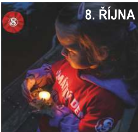
Společné setkání k Památnému dni sokolstva.