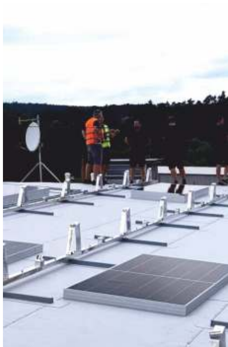
Postupná instalace fotovoltaických panelů na nové střeše ZŠ na výrobu elektřiny