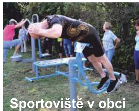
Sportoviště v obci