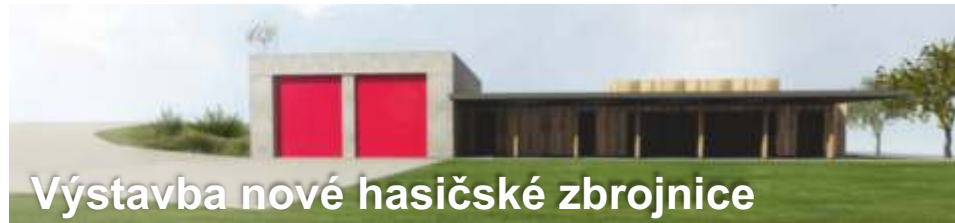
Výstavba nové hasičské zbrojnice